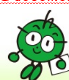
チャレンジココロ