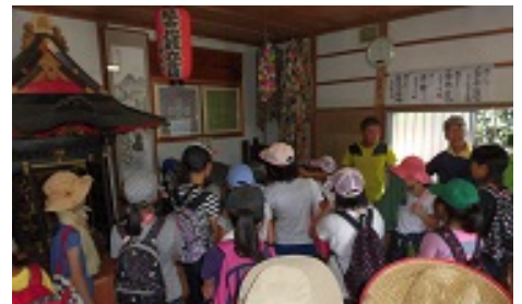
おしゃか様！ここは、むかし「てらこや」