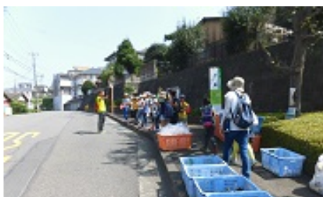
綾瀬市は、ごみの分別を30年前から…