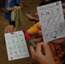
全部さがせたよ！フルビンゴ!!