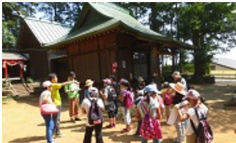
しぜんとれきしかんさつ会へ、GO！

家族みんなで、ふりかえりと、思いで話を楽しんでもらえるように、AECつうしん第6号特別版をはっこうします。