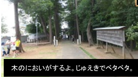
木においがするよ。じゅえきでベタベタ。