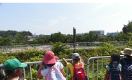
あれは、何でしょう？