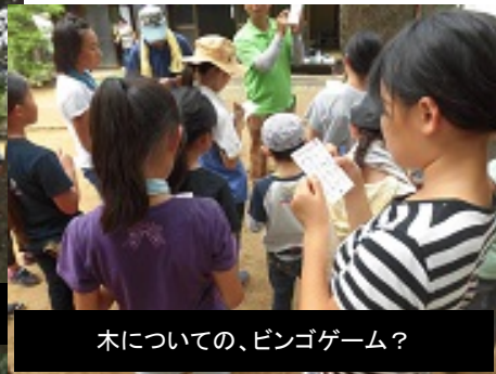
木についての、ビンゴゲーム?