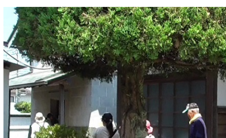
「くら」って、農家のちよぞうこなんだ！