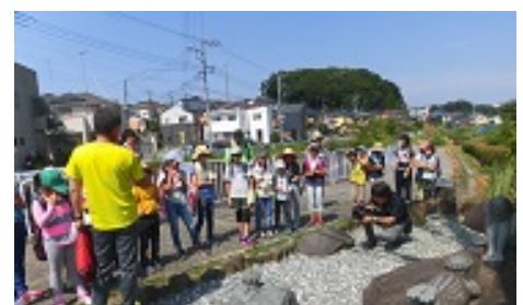
目久尻川、カッパ伝説は…