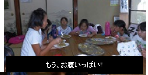
もう、お腹いっぱい!!