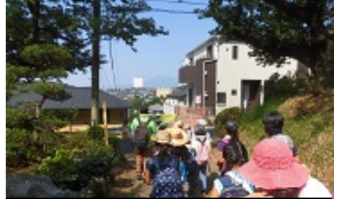
今日は、富士山見えないー