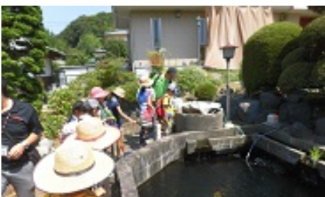
井戸の中をのぞいてみました。