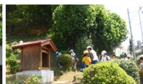
しぜんかんさつ終わり。つかれた～。