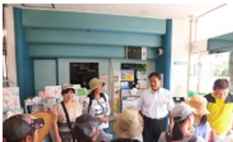
JAのお仕事は…、何だっけ？