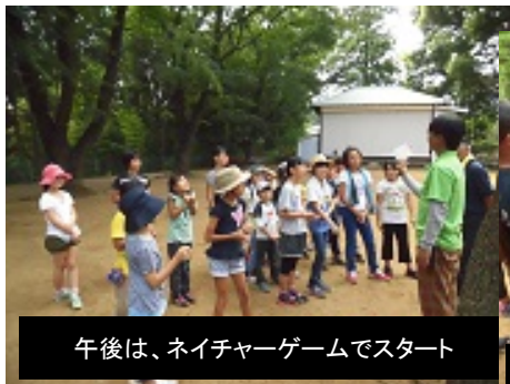
午後は、ネイチャーゲームでスタート