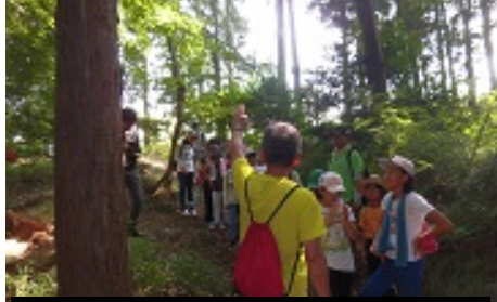
森の土はなぜ、ふわふわするんだろう？