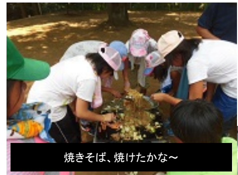
焼きそば、焼けたかな～