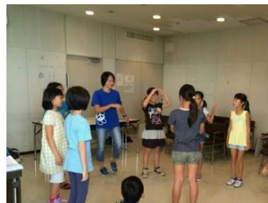
〈みんなでゲーム〉 新メンバーも楽しく参加