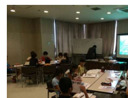
みんな熱心に、ビデオ鑑賞中