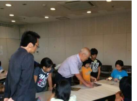
てんじぶつ さくせい ふうけい 展示物作成の風景