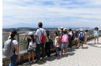
屋上から市内展望

http://www.city.ayase.kanagawa.jp/hp/page000031800/hpg000031740.htm